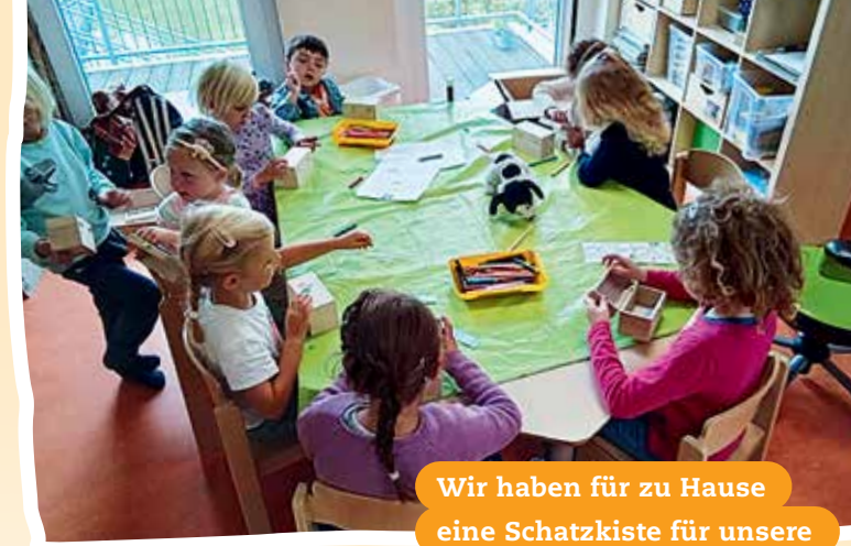
Wir haben für zu Hause eine Schatzkiste für unsere Privatsphäre gebastelt.

Jedes Kind hat das Recht, zur Schule zu gehen und zu lernen. Im Kindergarten lernen wir durch Spielen, Singen und Basteln. Das macht viel Spaß!