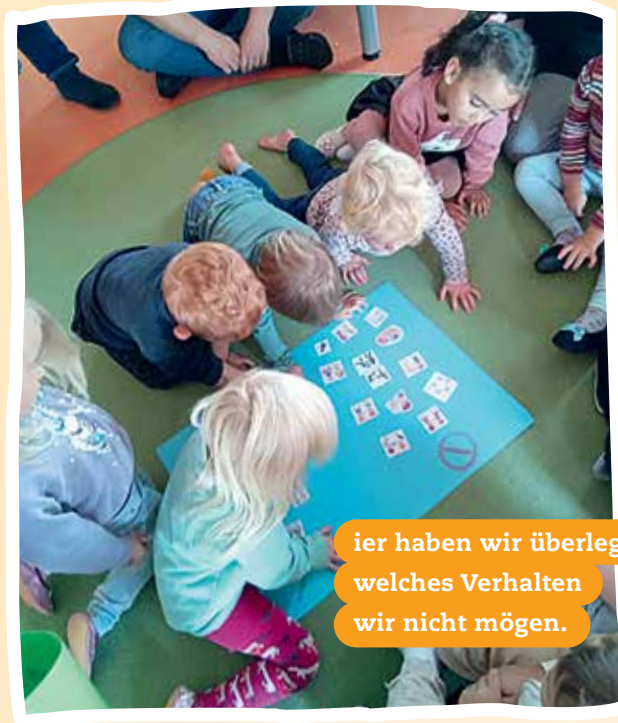
hier haben wir überlegt, welches Verhalten wir nicht mögen.

Hallo liebe Freunde! Heute möchten wir euch etwas ganz Wichtiges erzählen: unsere Kinderrechte! Wir, die Kinder der AWO Kita Steinbach, haben viele Rechte, die uns helfen, glücklich und sicher zu sein. Wir können unsere Rechte jeden Tag leben! Wenn wir spielen, lernen und unsere Meinung sagen, zeigen wir, dass wir unsere Rechte kennen. Außerdem können wir unseren Freunden helfen, ihre Rechte zu verstehen. Kinderrechte sind wichtig für uns alle! Lasst uns dafür sorgen, dass jedes Kind in unserem Kindergarten und auf der ganzen Welt glücklich und sicher ist. Gemeinsam können wir viel erreichen! Lasst uns gemeinsam entdecken, was das bedeutet!