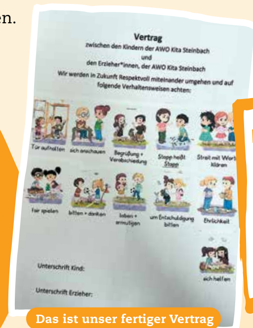
Das ist unser fertiger Vertrag zu den Kinderrechten, den wir gemeinsam gestaltet haben.

Das Recht auf gewaltfreie Erziehung ist für uns ein sehr wichtiges Recht. Wir haben dazu einen Vertrag entwickelt, wie wir in der Kita miteinander umgehen wollen. Uns ist ein respektvoller Umgang wichtig und wir leben diesen im Alltag.