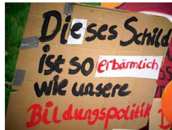
Eines von zahlreichen kreativen Schildern.

Beim Unterbezirk sind vor allem Beratungs- und Unterstützungsdienste wie in der Suchthilfe, im