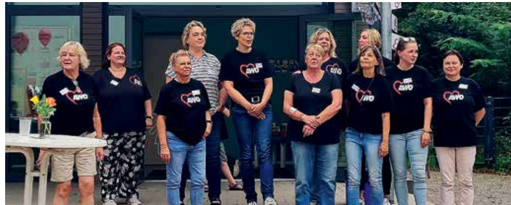
Das Team der OGS Anton-Wiggermann Schule in Hochlar.