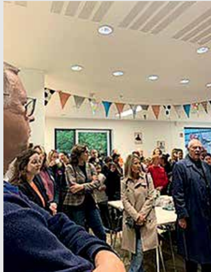
Viele Gäste kamen zur Eröffnung in den Quartierstreff.