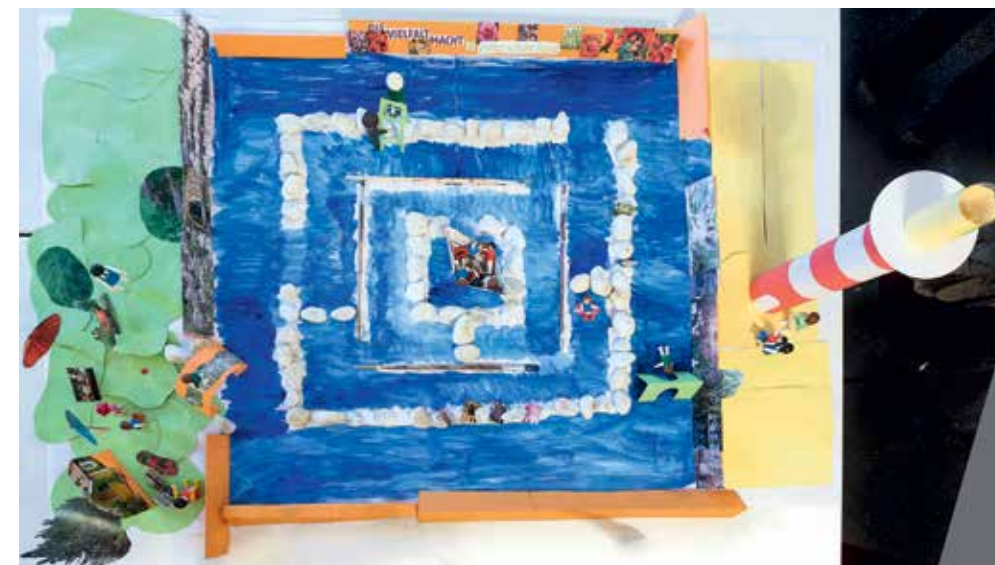
Mitarbeiter*innen haben auf einer eintägigen Fortbildung im Schloss Herten den Leitsatz Verschiedenheit als Chance kreativ umgesetzt.