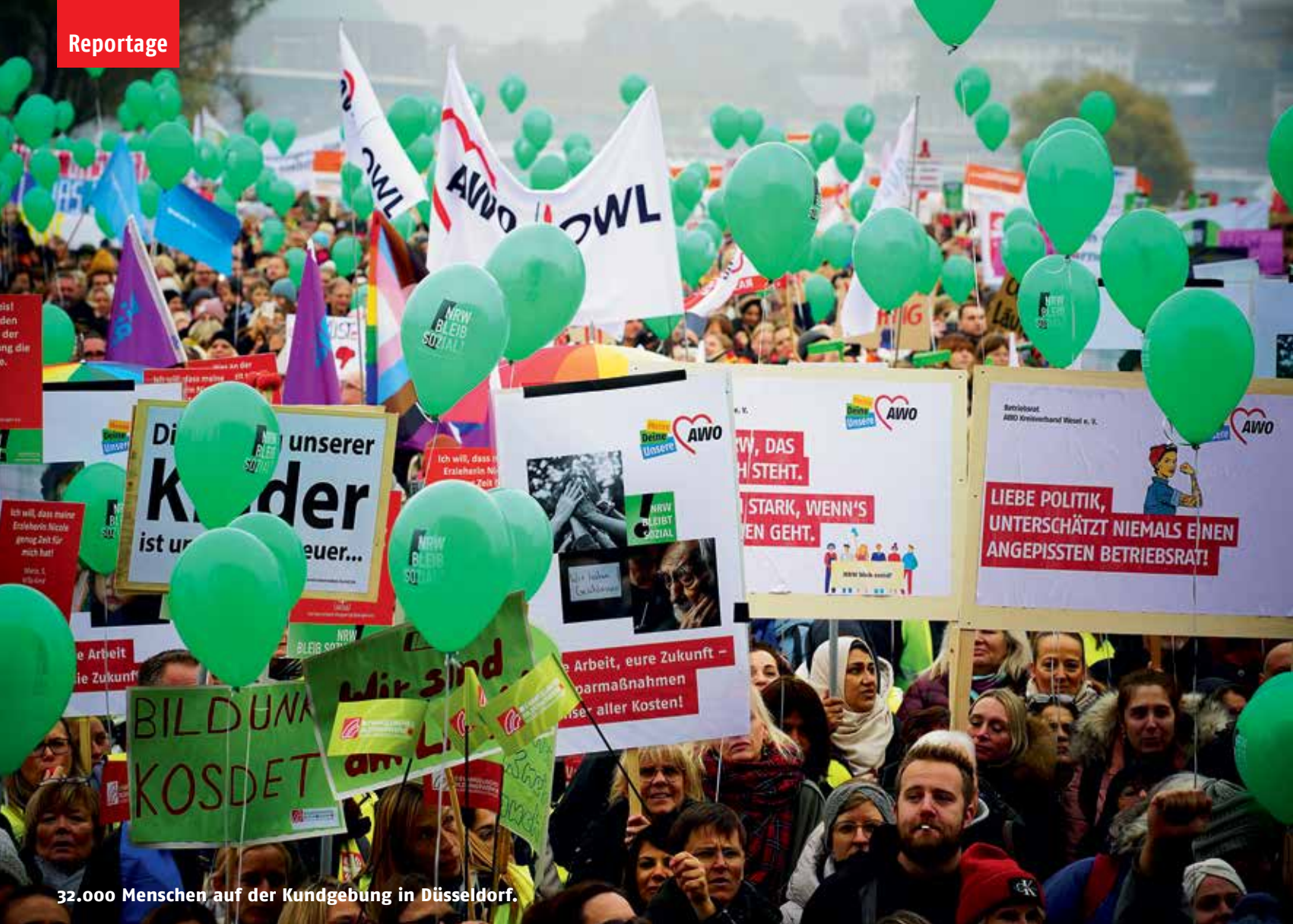
32.000 Menschen auf der Kundgebung in Düsseldorf.