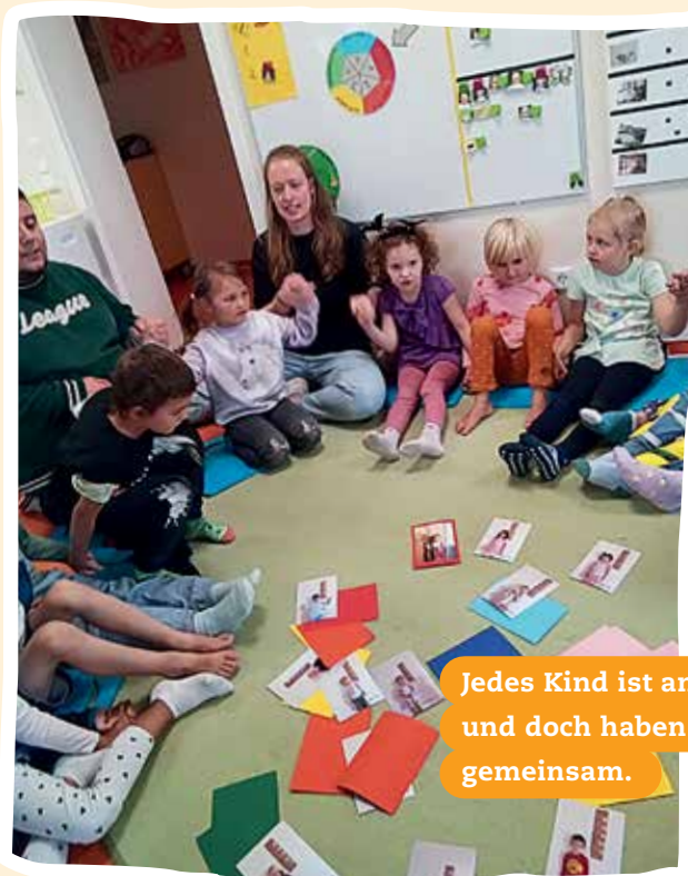
Jedes Kind ist anders und doch haben wir viel gemeinsam.

Wir haben das Recht, zu spielen und Spaß zu haben! Im Kindergarten gibt es viele Spiele und Spielzeuge, die uns helfen, neue Dinge zu lernen und Freunde zu finden.