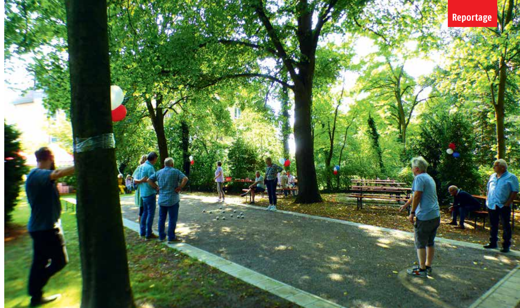
Schattig unter alten Bäume lässt es sich prima im Sommer Boule spielen.

Abschlussfeier bei uns feierte. Vor eineinhalb Jahren haben wir unsere Küche inklusiv umgebaut, sodass auch Menschen mit Behinderung sie nutzen können. Ich selbst habe meine Enkelkinder und deren Freunde angestiftet und konnte einige im Alter von 14 bis 17 Jahren gewinnen, die sich um die Technik gekümmert haben. Einer von ihnen ist auch sehr IT-begeistert und könnte vielleicht demnächst Workshops für weniger Technikaffine anbieten. Es waren etwa 100 Gäste da, damit sind wir ganz zufrieden. Das Schöne ist, dass einige schon am darauffolgenden Dienstag erstmals zum Boulenachmittag kamen. Die Arbeit trägt also Früchte.