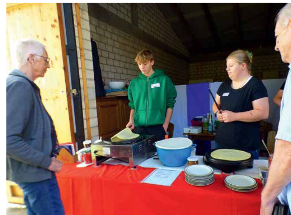
Passend zum französischen Nachmittag zur Eröffnung der Boulebahn gab es selbstgebackene Crepes.